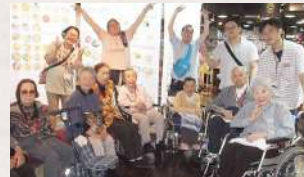
ラーメン博物館に行きました