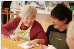
昼食の準備の風景

日々の家事（料理・洗濯・掃除など）は生活自立能力を維持するケアの一環として、可能なかぎりご参加いただいています。