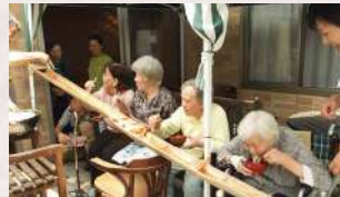
夏の恒例イベント流しそうめん