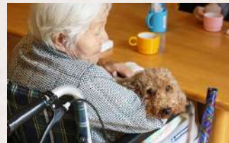
お膝の上大好きです