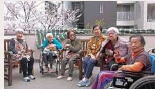
春にはバルコニーでお花見ができます♪

ご入居者にその方らしい普通の生活をしていただくことを日々心掛けています。買い物や電車での外出、地域主催の教室への参加など、「社会性」を大切にしています。また、季節を感じられるような様々な行事、外泊旅行などのイベントも企画実施しています。