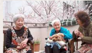
“なな”もお花見に参加です