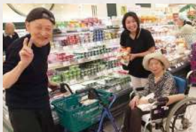
お買い物もお手伝いいただいています