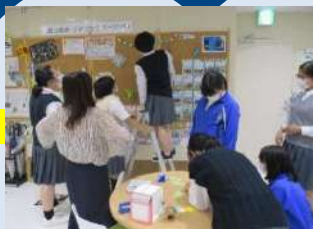
『万騎が原中学校ボランティア部』 素敵な飾りを作ってもらいました。