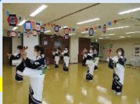
『旭区老人クラブ連合会女性委員会』 による踊りの披露から始まり、 あっという間の練習会は大変好評でした。