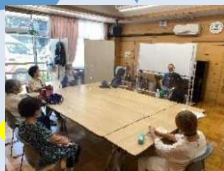
『活動ホームふたまたがわ敷地内の 花壇ボランティア』立ち上げに向け、 施設見学と今後に向けて話し合いをしました。

7月は、地域の各団体と連携して、 初めての取組を実施しました。参加者から も好評の声を多くいただきましたので、 次回はより多くの方に楽しんでいただ けるよう取り組んでいきたいと思ひます。