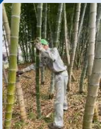
『さちが丘西部自治会公園愛護会』 立派な竹をいただきました！