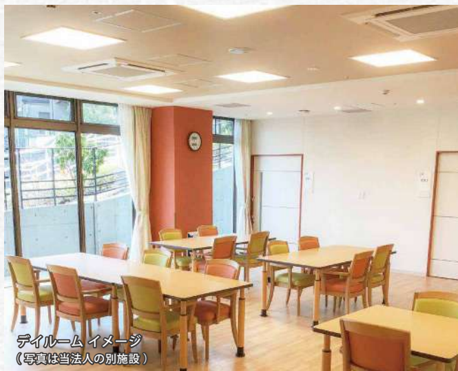
ダイニング イメージ (写真は当法人の別施設)