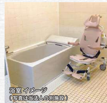
浴室イメージ (写真は当法人の別施設)